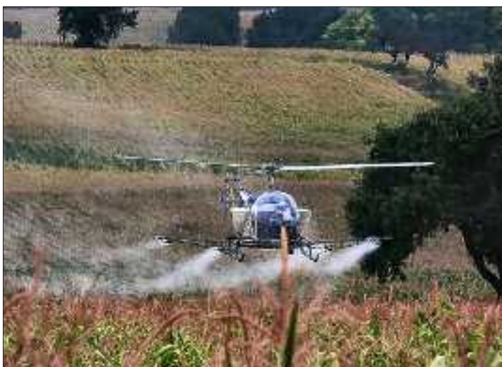
Le but des militants des Amis de la Petite Camargue : se mobiliser pour l'environnement, au-delà du seul périmètre de la réserve, comme lors de la crise de la chrysomele.

L'autonomie des Amis de la Petite Camargue alsacienne leur a aussi permis de se tourner davantage vers le militantisme et la protection de la nature et de l'environnement dans la région frontalière. Une transition « nécessaire »... Lancée dès 1993, avec la création d'Osez Vélo, à Saint-Louis, ou en 1996, avec la création du Regiobogen, des citoyens allemands qui voulaient créer des trames vertes trinotionales. « Nous avons été parmi les membres fondateurs du TRUZ à Weil am Rhein ». En 1999, c'est au tour d'un grand collectif de voir le jour, avec six associations : Outre les Amis de la Petite Camargue, les « Qualité de vie » de Blotzheim, Hégenheim, Bartenheim, DIC et l'APOE. « Nous avons mené des actions très fortes ensemble, contre la station d'épuration de Sierentz, dans la lutte contre la chrysomele, en manifestant contre le Gaucho avec les apiculteurs, en soutenant l'ADRA et les riverains de l'EuroAirport... » Actions contre le déboisement, la pollution, pour les zones Natura 2000... « C'est aujourd'hui encore comme cela. Il faut être sur tous les fronts. Mobiliser les énergies. Prenez les enquêtes publiques. Les gens ne se rendent pas compte combien c'est important d'y participer. Sinon, on se trouve avec des bâtiments qu'on ne voulait pas, comme dans le dossier de la rue du Rhin à Saint-Louis. »