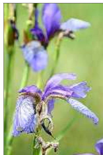
À la Kirchenerau, les iris de Sibérie finissent de fleurir.