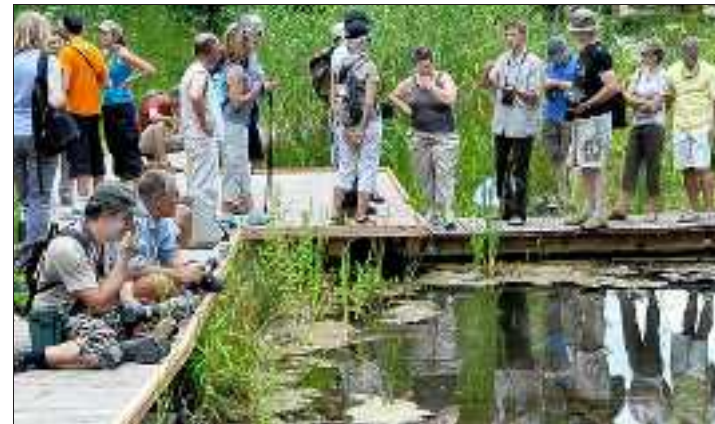
Aujourd'hui, le public plébiscite la réserve naturelle qui propose de nombreuses animations et visites guidées.