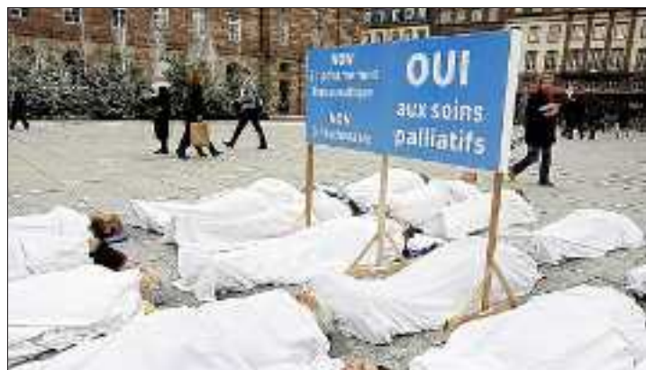
Les organisateurs du congrès s'attendent à des contre-manifestations d'associations de défense de la vie, comme ici à Strasbourg, en janvier dernier.