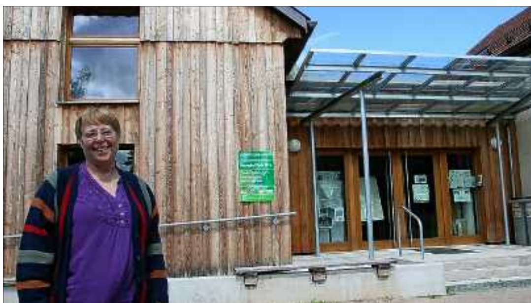
La maison éclusière symbolise l'extension de la Petite Camargue alsacienne et le travail réalisé dans les années quatre-vingt-dix et au début des années 2000 par les militants.

« En 1991, nous avons tout de suite demandé que les 104 hectares du