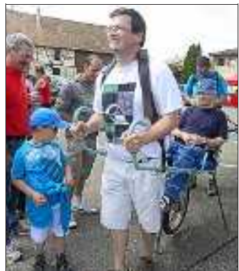
Avec 926 participants, la 10 e marche des Pieds Agiles a battu son record.