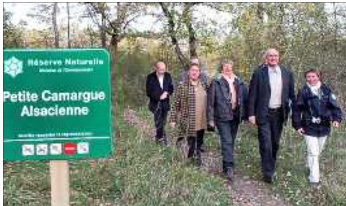
Le soutien des politiques qui ont compris l'importance de la Petite Camargue : en 2006, visite d'Adrien Zeller.