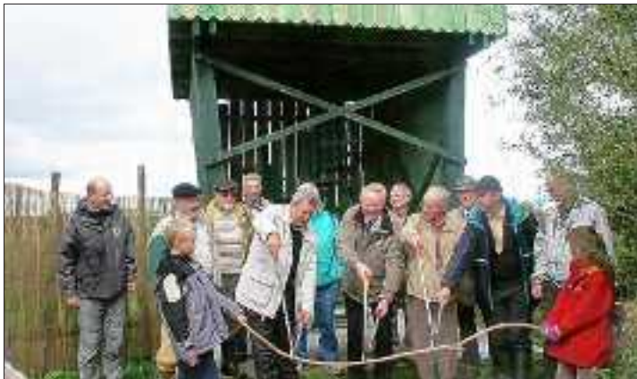
La place des militants et des bénévoles : inauguration en 2004 d'un observatoire des Bras Cassés.